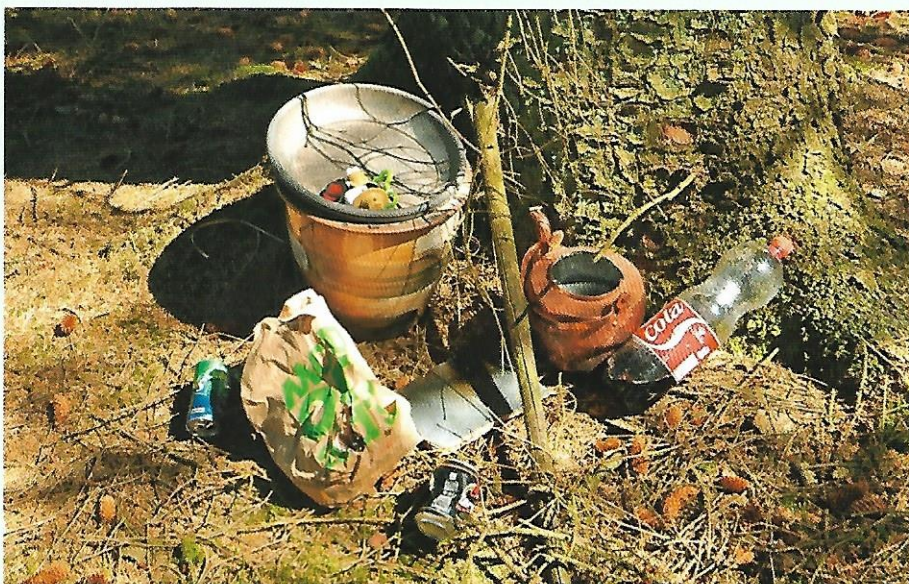
Affald der er efterladt ved Tranekær i ugen inden Skovens Dag.

- Jeg var forbi for en uge siden og fandt noget henkastet affald som jeg satte om bag et træ. Jeg kiggede lige forbi i morges, og nu var der kommet nogle flasker og dåser. Vi har overvejet at lave en parkeringsplads ude ved landevejen og opsætte en