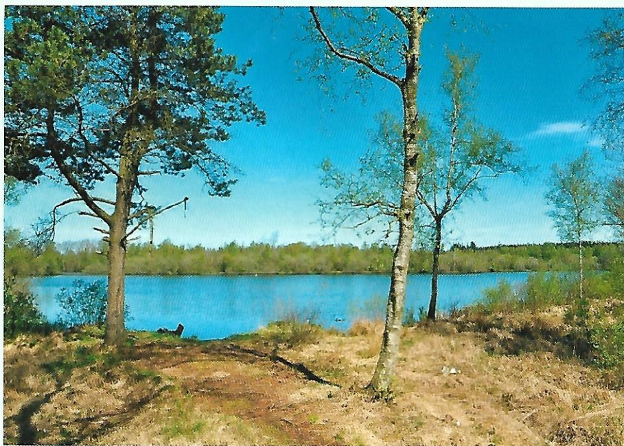
Tranekær er et populært udflugtsmål, og på dette sted har jagtforeningen opsat borde og bænke.

til vores plantager hvis de kan forbedre jagten. Vi er ikke interesseret i skovrejsning i større omfang.