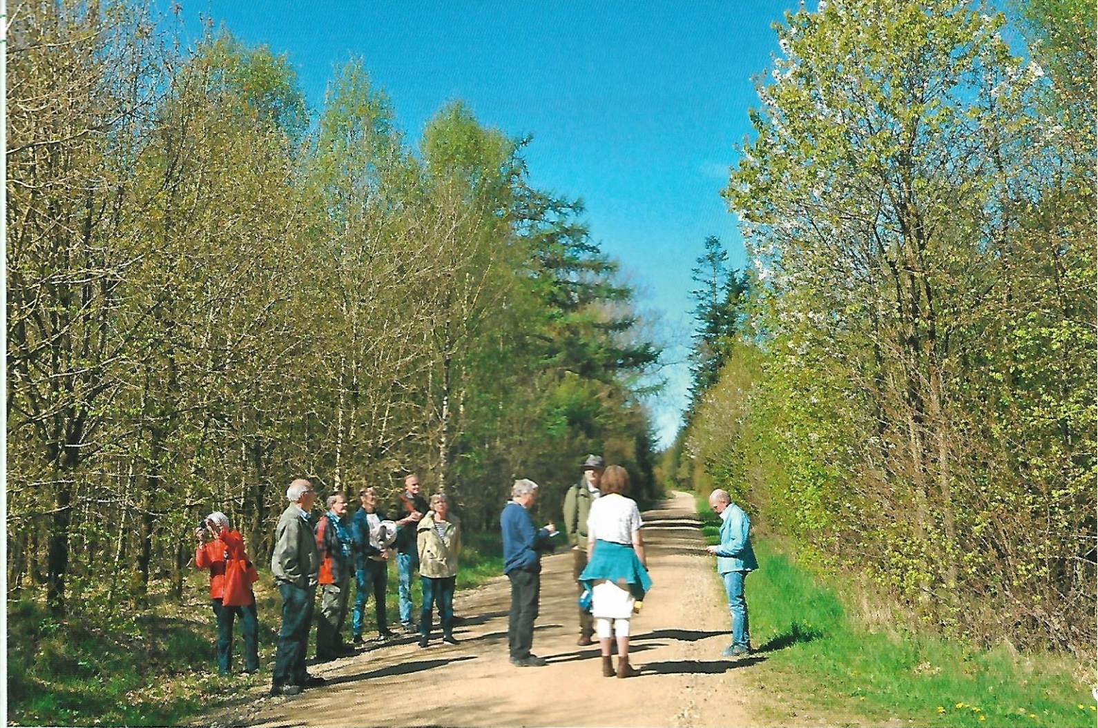
Langs Asserholtvej findes en række forskellige løvtræarter, som skaber variation og stabilitet.