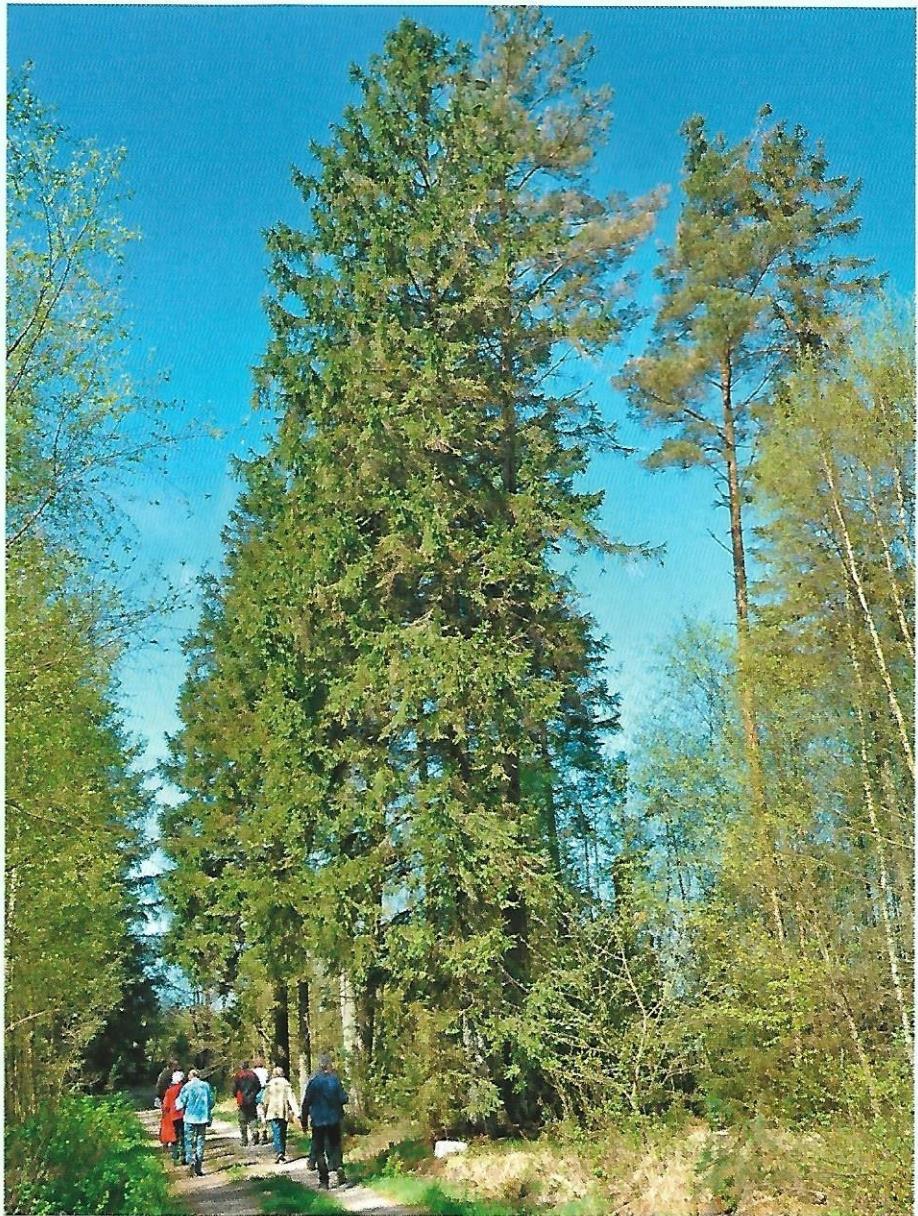
Der er stadig enkelte træer tilbage fra plantagens anlæg sidst i 1800-tallet.

- Vi er positive over for at opkøbe mindre naturarealer der støder op