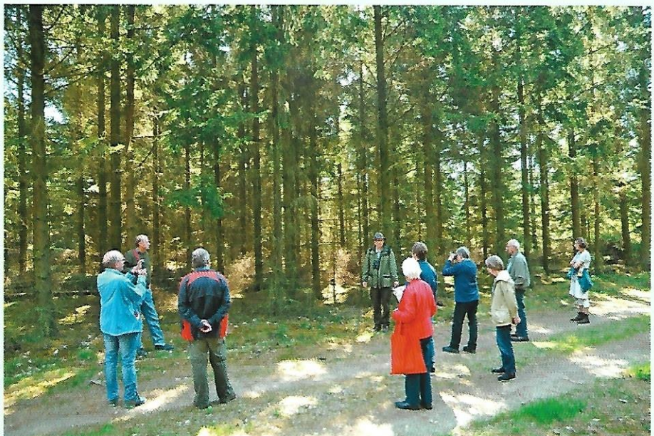
De 11 deltagere på Skovens Dag i Staushede Plantage hørte om drift af skoven, historien bag plantagen og skovens økonomi.